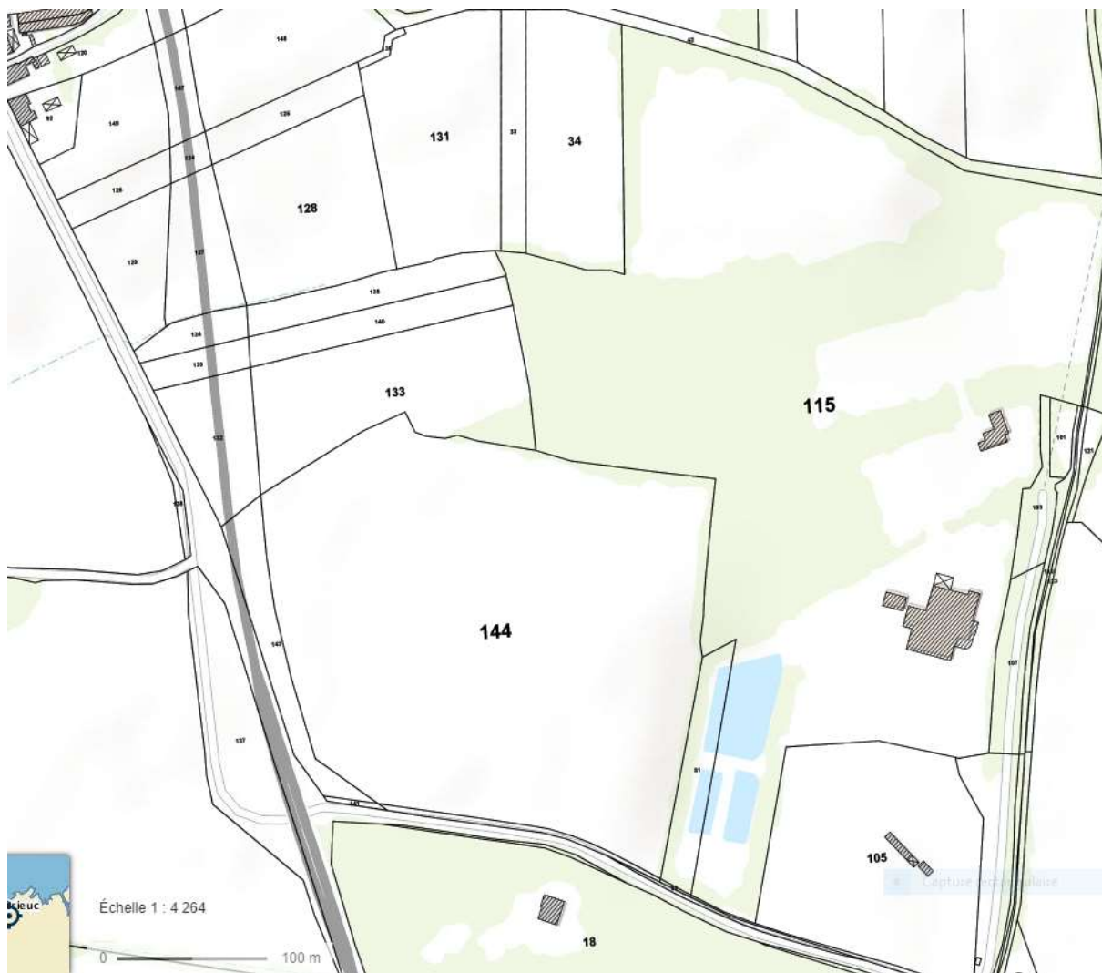
Parcelle UIOM Planguenoual N° 115